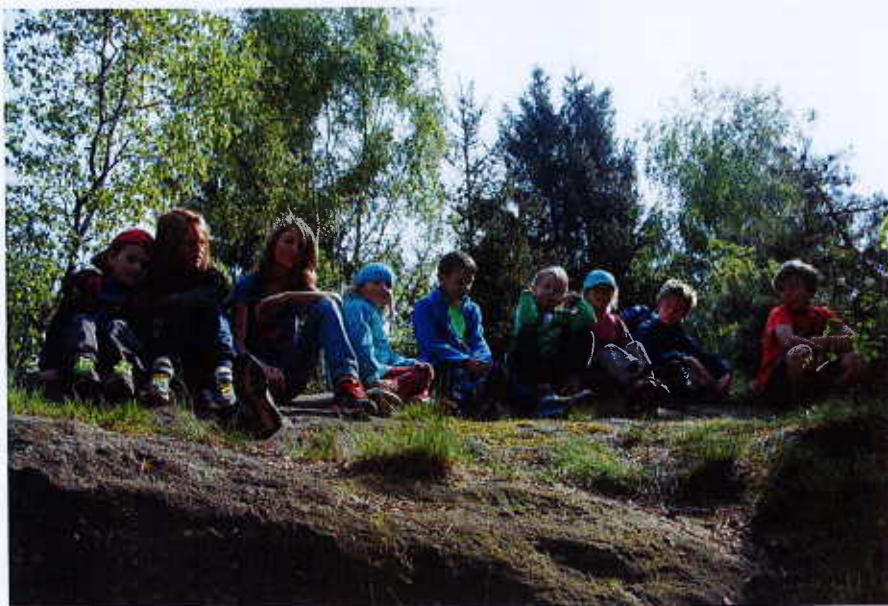
An der Fuchskanzel (2015)

Für 2018 ist eine Exkursion zum „Matterhorn“ des Zittauer Gebirges im Naturpark geplant. Die Anreise wird mit öffentlichen Verkehrsmitteln erfolgen. Insbesondere die teilnehmenden Kinder und Jugendlichen werden durch ein Quiz angeregt, sich mit den Informationen zu Naturschutz, Heimatkunde und Umwelt zu befassen. Natürlich wird die Mühe auch mit kleinen Preisen belohnt.