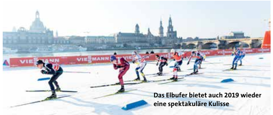
Das Elbufer bietet auch 2019 wieder eine spektakuläre Kulisse