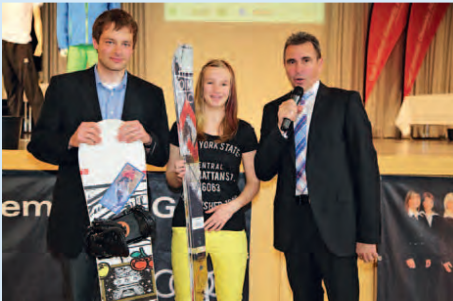
Die Gewinner der Hauptpreise aus der Tombola