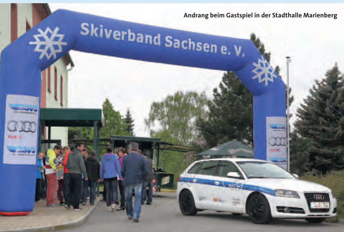
Andrang beim Gastspiel in der Stadthalle Marienberg

Einst bekamen auch Denise Herrmann oder Michael Rösch diesen Preis. Inzwischen haben beide olympische Medaillen. Und auch hier gab es ein Novum. Erstmals war es seit 18 Jahren kein Skispringer, sondern