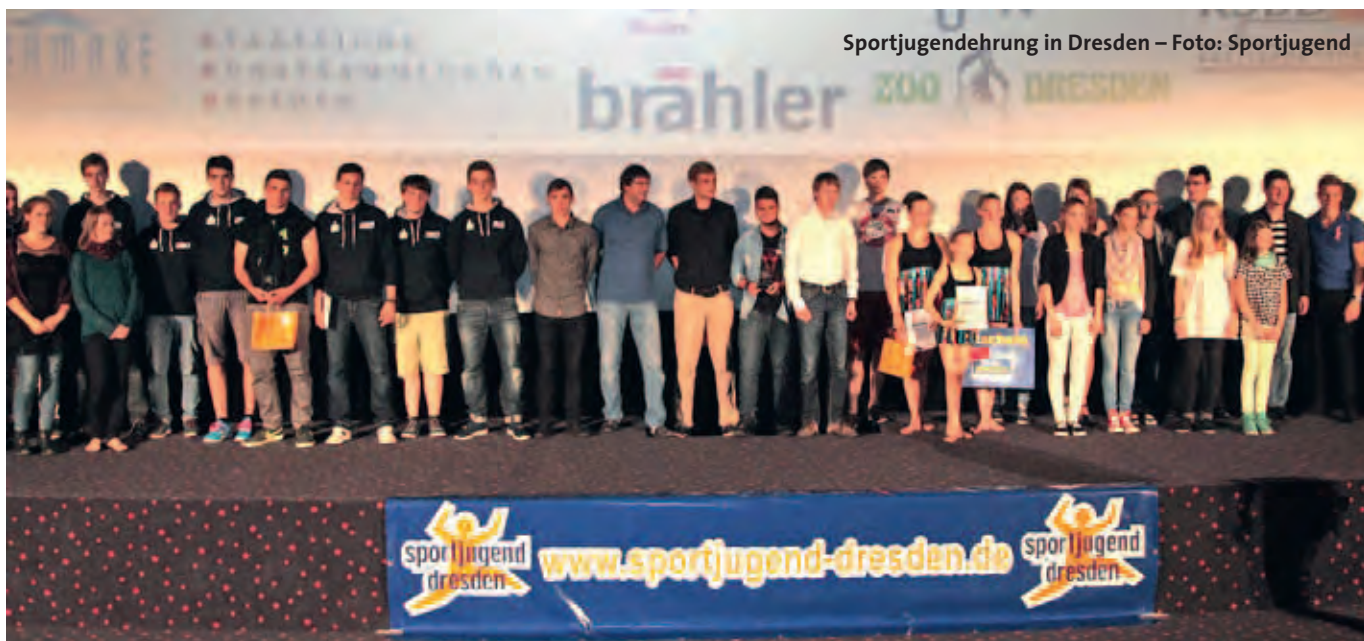
Sportjugendehrung in Dresden

Nach einem gemeinsamen Sommertrainingslager und der bereits von etlichen Wettkämpfen gefolgt Saisonöffnung am 11. September sind die Dresdner nun bereit, an diese Erfolge anzuknüpfen.