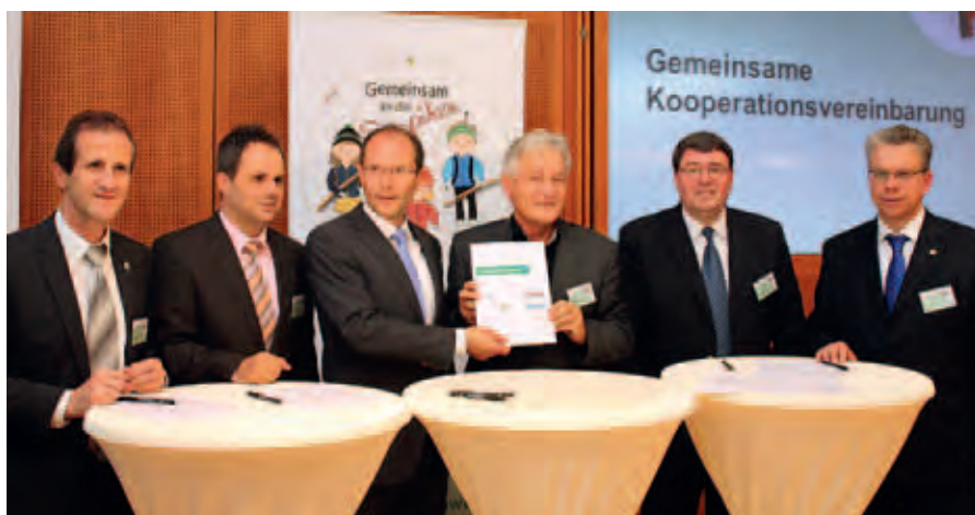
Unterzeichnung der Vereinbarung

Text: IAT/Skiverbandsachsen