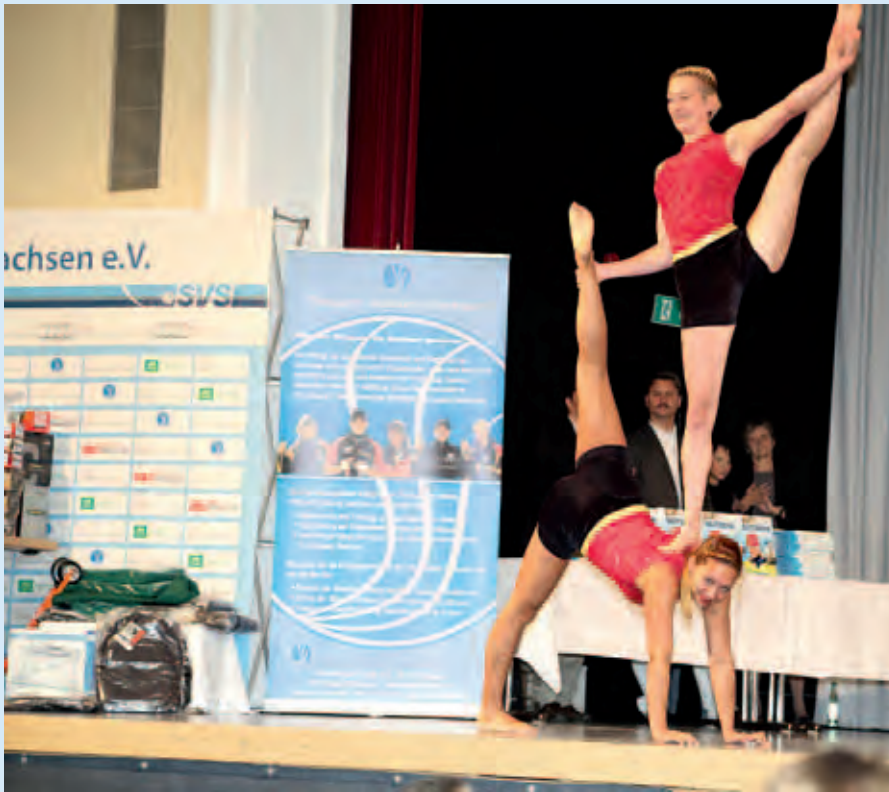
Die Showeinlagen des Sportensembles Chemnitz