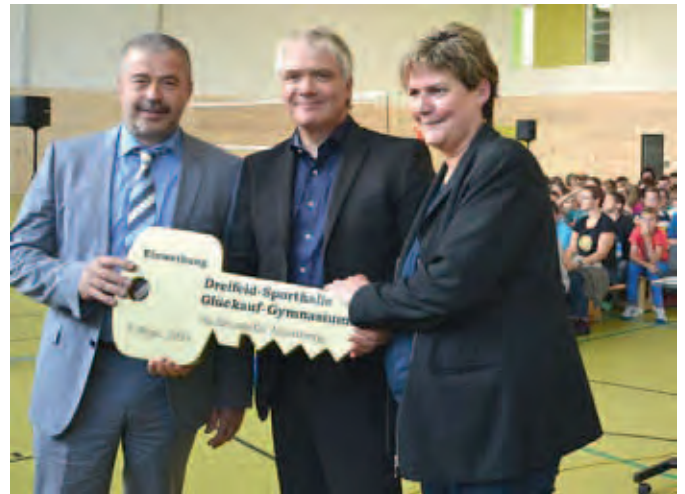
Schlüsselübergabe in der Turnhalle