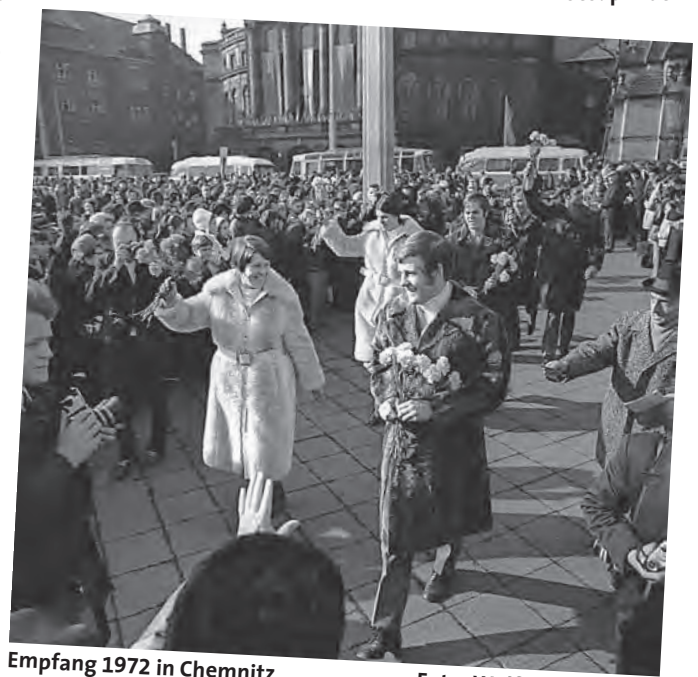
Empfang 1972 in Chemnitz

Text: Skiverband Sachsen (vf)