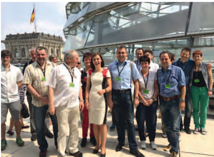
Auf dem Deutschen Bundestag